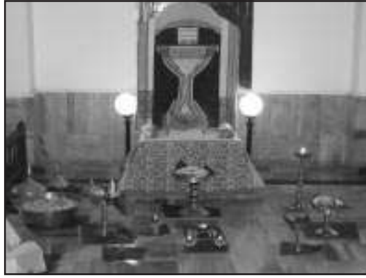
গুৱাহাটী ৰামকৃষ্ণ মিছনত শ্ৰীমন্ত শঙ্কৰদেৱৰ তিথি উদ্‌যাপন

আৰু ৰামানুজৰ বিশিষ্টাদ্বৈতবাদ প্ৰধানকৈ উল্লেখযোগ্য। আচলতে, বেদান্ত বুলিলে অদ্বৈত বেদান্তকেই বুজা যায়। শংকৰাচাৰ্য্যৰ বেদান্ত বুলিলে অদ্বৈত বেদান্তকেই বুজা যায়। শংকৰাচাৰ্য্য আৰু ৰামানুজ দুয়োগৰাকী অদ্বৈতবাদী। দুয়োগৰাকীয়ে ব্ৰহ্মক পৰম সত্ত্বৰূপে মানি লৈছে আৰু জীৱ-জগতৰ সুকীয়া অস্তিত্ব অস্বীকাৰ কৰিছে। কিন্তু দাৰ্শনিক দৃষ্টিকোণৰ ফালৰ পৰা দুয়োগৰাকীৰ মাজত সূক্ষ্ম পাৰ্থক্য আছে। প্ৰশ্ন হ'ল, ভাগৱত পুৰাণৰ অনুপ্ৰেৰণাত গঢ়ি উঠা শংকৰদেৱৰ বৈদান্তিক মত কোনটো পথৰ লগত মিলে, শংকৰাচাৰ্য্যৰ পূৰ্ণ অদ্বৈতবাদৰ লগত নে ৰামানুজাচাৰ্য্যৰ বিশিষ্টাদ্বৈতবাদৰ লগত? এই ক্ষেত্ৰত অদ্বৈতবাদ আৰু বিশিষ্টাদ্বৈতবাদৰ মাজৰ পাৰ্থক্য নিৰ্দ্ধাৰক প্ৰধান তত্ত্ব কেইটাৰ বিষয়ে থোৰতে জানি লোৱা দৰকাৰ। কাৰণ,