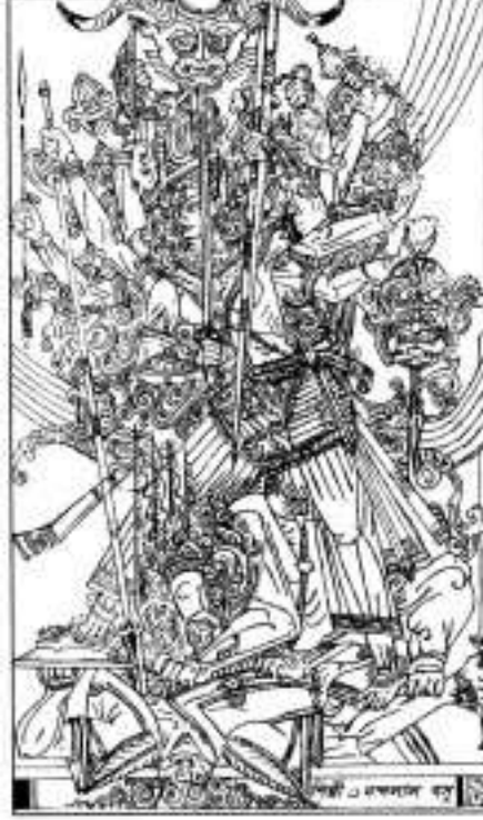
নন্দলাল বসুৰ অংকিত মা দুৰ্গা

কৰিবলগীয়া হৈছে। কিয়নো দীৰ্ঘদিন ব্ৰহ্মপুত্ৰ উপত্যকাত বসবাস কৰা বাবে হিন্দুত্বৰ প্ৰভাৱ ৰজাঘৰত পৰিছিল, কাৰণ উপত্যকাৰ বেছিভাগ অধিবাসীয়েই হিন্দু ধৰ্মালম্বী আছিল।